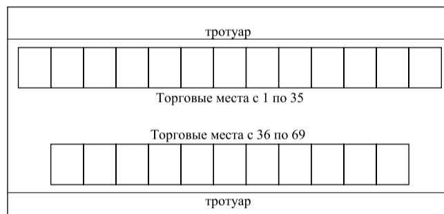
СХЕМА размещения торговых мест на муниципальной сельскохозяйственной ярмарке выходного дня на территории Кореновского городского поселения Кореновского района

Начальник организационно – кадрового отдела администрации Кореновского городского поселения Кореновского района